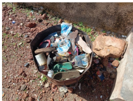
Figura 2 - Papelera en el mercado de Hérico Centro

Por lo que se refiere al vertedero municipal, este consta de un espacio para el almacenamiento de materiales no combustibles y un foso destinado a la incineración de los combustibles, ambos cerrados con puertas metálicas. Al exterior de dichos compartimentos, se encuentra un espacio donde se planeaba realizar la separación de los residuos y también se ha habilitado un área para realizar el compostaje del material orgánico recogido durante la limpieza del entorno del mercado. No ha sido posible dotar de puntos de agua al vertedero, aunque, según consta en el informe final del 3 er año, se ha dotado al comité de utensilios para el transporte de agua (bidones, etc.).