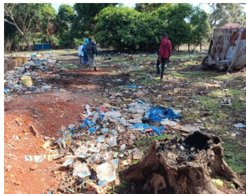
Figura 4 - Alrededores de vertedero del mercado de Hérico Centro

Se ha comprobado igualmente la presencia de algunos residuos sólidos mezclados con señales de quema en el área destinada a la descarga y separación de residuos. Se concluye, pues, que el vertedero puede haber sido diseñado presuponiendo una cantidad de residuos más elevada de la que en realidad se deposita y gestiona.