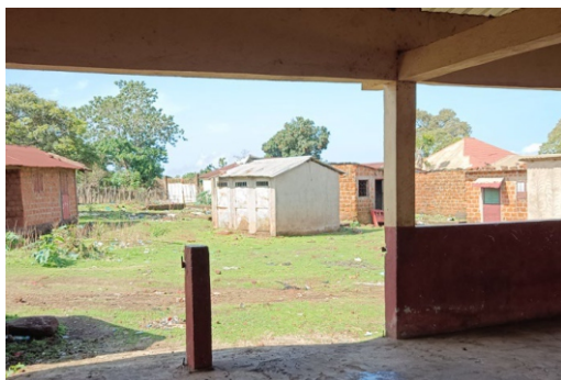
Figura 1 - Letrinas del mercado de Hérico Centro, cerradas