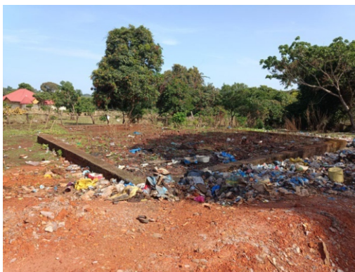
Figura 3 - Alrededores de vertedero del mercado de Hérico Centro

En el momento de la evaluación se constató la presencia de mucha basura alrededor del vertedero, y varias áreas y compartimentos sin uso.